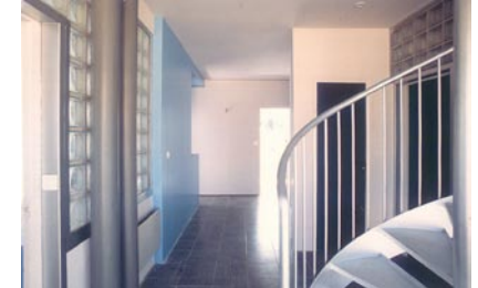
Vue de l'intérieur