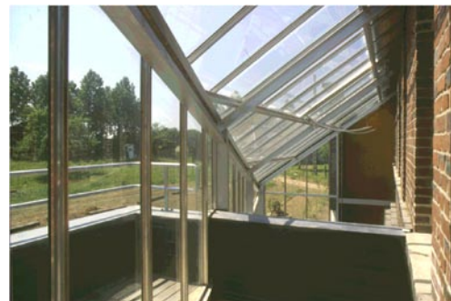
La maison dans son environnement rural, et l'espace de la serre.