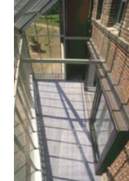
L'espace de la serre