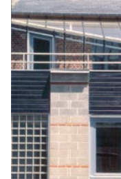
Matériaux de façade